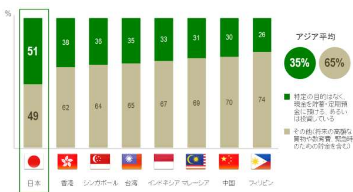
図 1:貯蓄全体のうち特定の目的がない貯蓄・投資が一番多い日本

アジア全体でも、投資家の多くはお金に関する決断をする際、主に自身の判断に頼っていると答えており、慎重な姿勢がうかがえます。調査では自分以外で影響力を持つのは家族であるという結果が出ています。日本では、投資家3人中2人(65%)、特に、男性の投資家では75%が投資に関して誰にも相談しないと答えています。誰にも相談しない理由としては、誰かに相談する必要性を感じない、あるいは自分にとって何が最善かは自分にはわからないからと回答しています。また日本は他のアジア圏よりもファイナンシャル・プランナーなど投資の専門家に相談をする人が少ないことがわかりました。