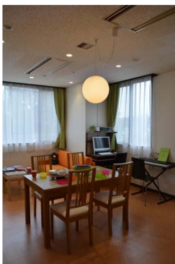
ダイニングテーブル、ソファ、 パソコン、電子ピアノ