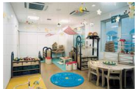
あいち小児保健医療総合センター 「わくわくる一む」

カナダをはじめとする欧米の小児医療先進国に比べても遜色ない施設、運営方式を取り入れた、国内で最も先進的な小児専門病院のひとつとして知られている愛知県立あいち小児保健医療総合センター（愛知県大府市）にて現在運用中のプレイルーム「わくわくる一む」をモデルとして、新規に導入を希望する全国の小児医療施設に、マニユライフ生命からの寄付金をもとに、理想的なプレイルーム『マニユライフわくわくる一む』の設置・運営を支援するものです。