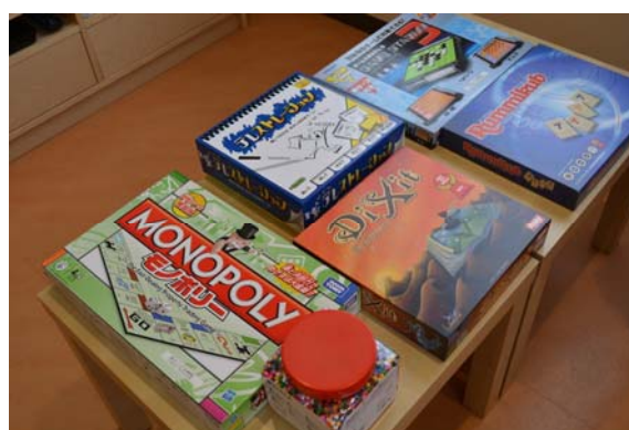
兄弟や、同世代の入院患者と遊べるゲームも充実