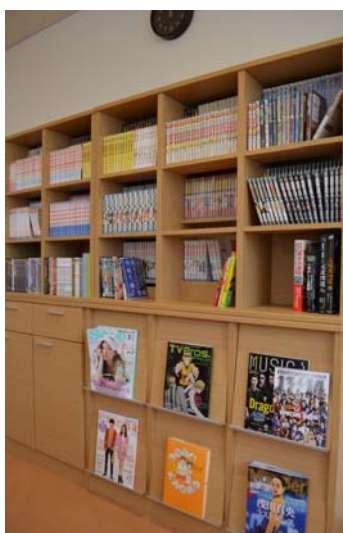
漫画本、DVD、雑誌が並ぶ本棚