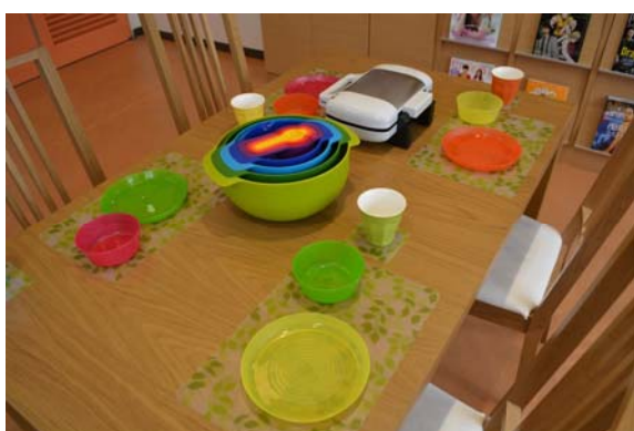
カラフルな食器が並ぶダイニングテーブル

同病院には、病棟・外来の各所にプレイルームが設置されていますが、主に乳幼児や学童期の子ども達が対象となっており、思春期の子ども達は入院中のほとんどを病室で過ごしています。思春期には思春期特有の発達課題・ニーズがありますが、そのニーズに答えられていないのが現状です。マニュアルわくわくるーむは、そうした思春期の子ども達向けのプレイルームとして、同年代の子ども達が触れ合い、学習・趣味を広げる場を提供し、年齢にあった活動を楽しめるような落ち着いた環境を目指しました。