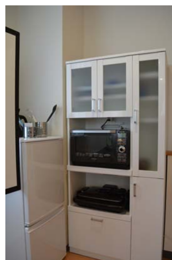
電子レンジ、ホットプレート、 冷蔵庫などのキッチン用品