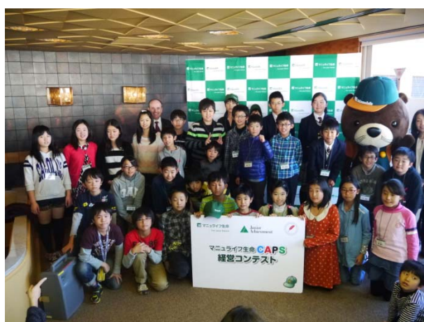
<全国から集まった決勝戦参加全メンバー>