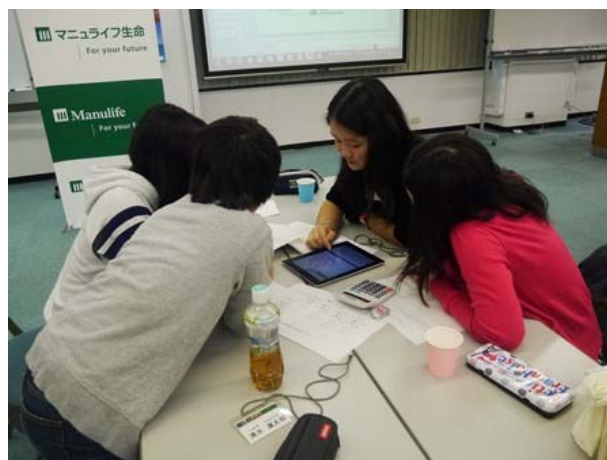
<戦略を練る子どもたち>