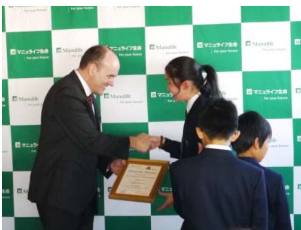
<表彰状を受け取り笑顔を見せる子どもたち>