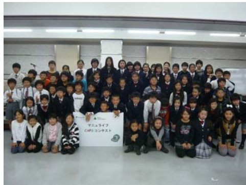
参加した全16チーム