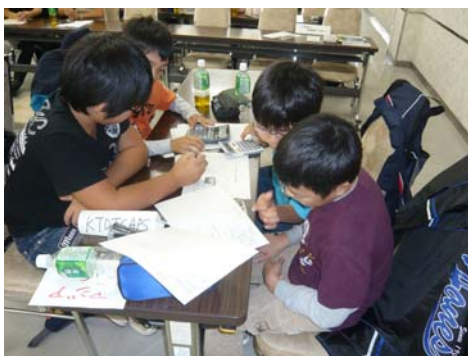
話し合いに熱が入る子ども達

優勝したチームのメンバーは次のようにコメントしています。「CAPSコンテストでチームワークの大切さがわかったのがやってよかった。在庫の数を減らしたり増やしたりと工夫しながらやりました。」