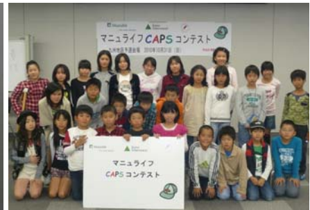
参加した全7チーム28人