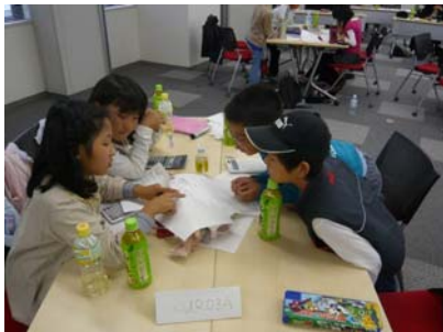
話し合いに熱が入る子ども達

保護者のコメント：「大人と同じ様に意見交換をしているのに驚いた。また、一見複雑そうに見えるプログラムが分かりやすく説明されていて感心した。」