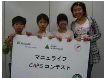
優勝した DREAM3HS チーム