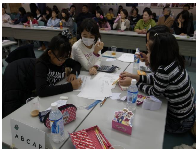
<真剣に話し合う子どもたち>