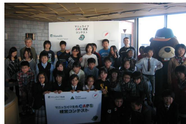
<決勝戦に参加した子供たち全員で記念撮影>