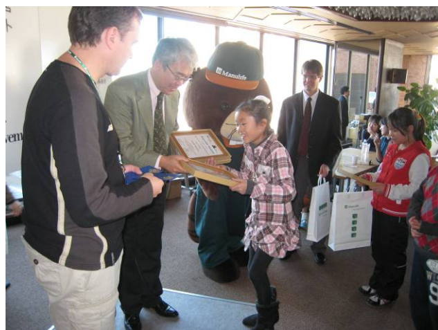
<表彰状を受け取り笑顔を見せる子供たち>