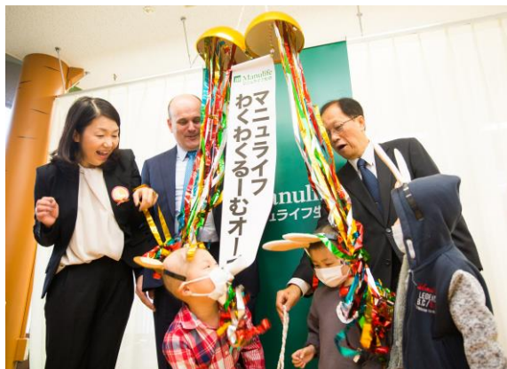
「わくわくる一む」の開設を祝うくす玉を割る子どもたち