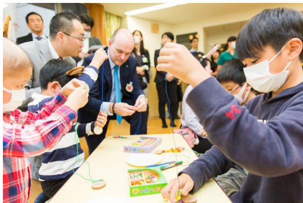
「わくわくる一む」でおもちゃ作りに挑戦する子どもたち