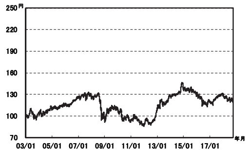
特別勘定の平均資産構成比