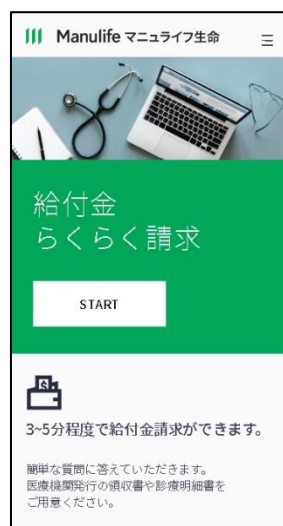
スタートページと入力画面例

*2 お支払い期日をお約束するものではありません。また個別事情により、お支払い審査に期間を要する、あるいは保留になる場合もあります。